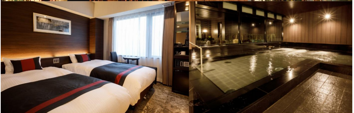
Standard Twin Room 16-17 sqm