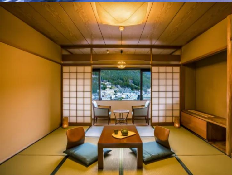
Standard Japanese-style Room 49.5m